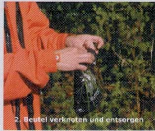
2. Beutel verknoten und entsorgen