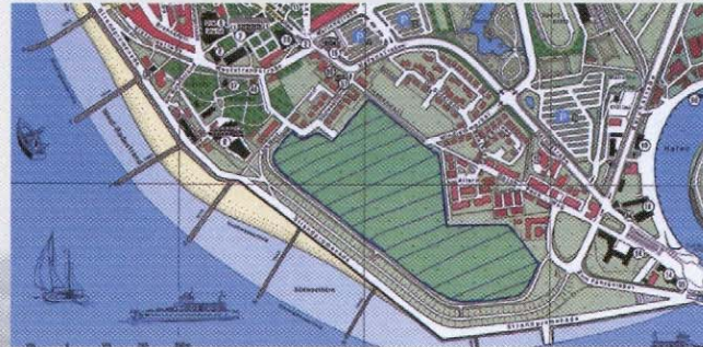
■ Wiesenfläche „Alter Fliegerhorst“

Aber keine Regel ohne Ausnahme: Auf der Wiesenfläche des „Alten Fliegerhorstes“ darf Ihr Hund ohne Leine herumtollen.