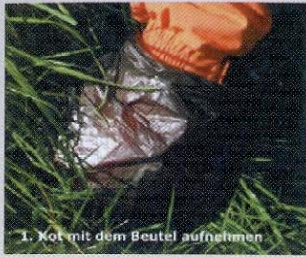
1. Kot mit dem Beutel aufnehmen