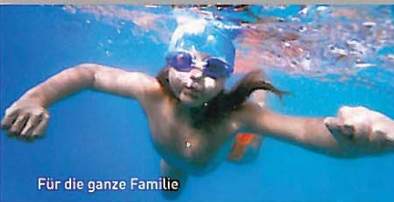
Für die ganze Familie