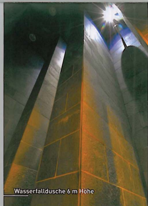
Wasserfalldusche 6 m Höhe

→ klassische Sauna (90°C) → Kelo-Außensauna (80°C) auf der Dachterrasse → Dampfsauna → Bio-Sauna (55°C) → Waschbad → Schlammbad → drei Massageräume → vier Schwebeliegen zur Behandlung mit Schlick in einem 34°C warmen Wasserbett → Privat-SPA Raum → Solarien → großzügige Ruhebereiche mit Wärmeliegen und Kaminen