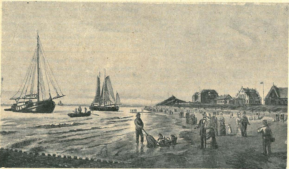
Der Weststrand im vorigen Jahrhundert mit den ersten Dünenschutzwerken und Bühnenbauten

Datums handelt. Unter ähnlichen Einflüssen, die in Hebungen und Senkungen zum Einbruch und damit zur Bildung des Aermelkanals führten, ist — ungefähr vor rund 2000 Jahren — das Entstehen der Inselkette anzunehmen. Die unablässig wirkenden Naturkräfte des Gezeitenstromes, der Brandung, des Windes und der Sandwanderung ließen ihre Gestalt wechseln. Inseln verschwanden und neue Eilande stiegen aus den Fluten