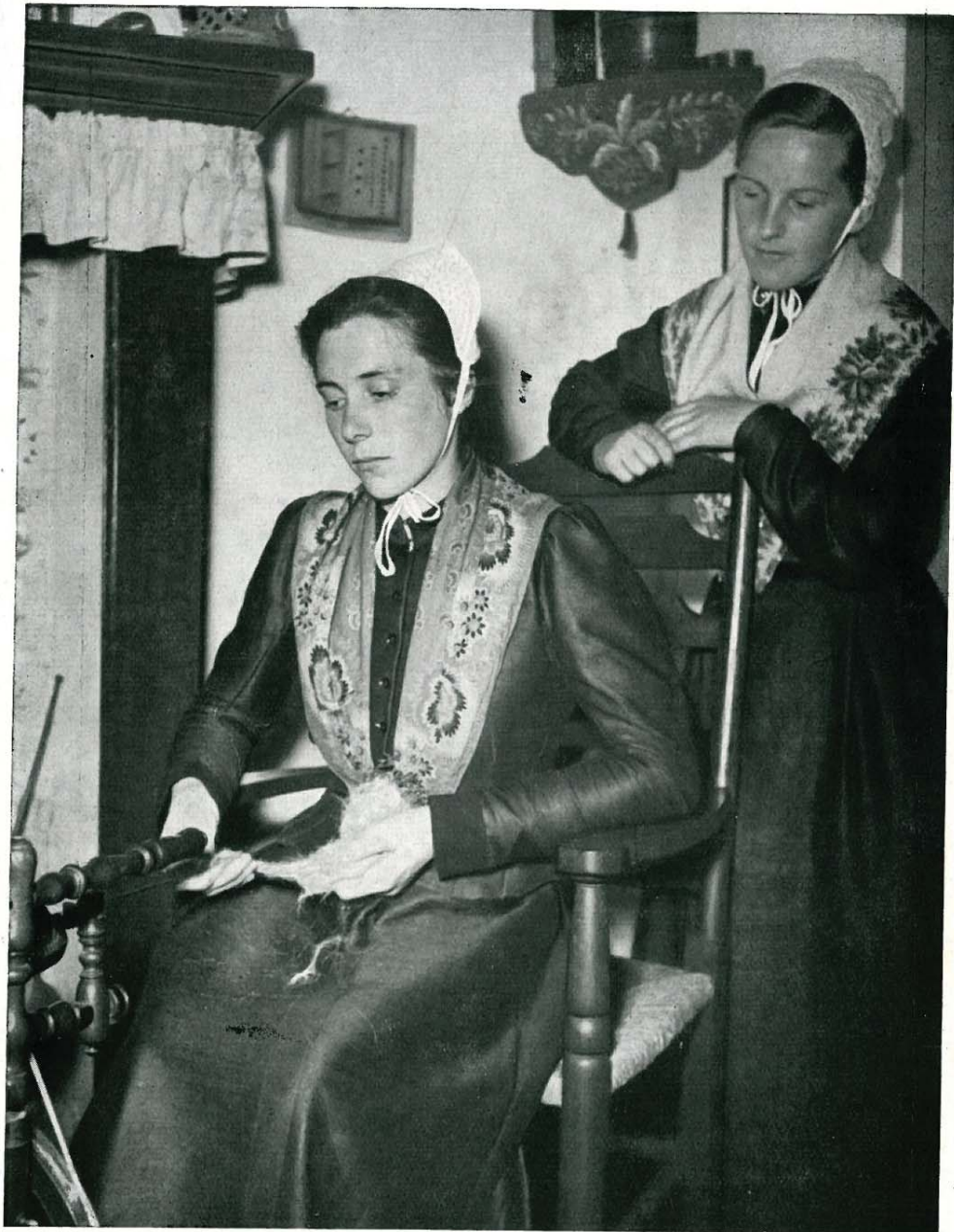
Norderneyerinnen in ihrer schmucken Tracht

HEILBAD FÜR LUFTWEGE NERVEN REKONVALESCENZ ABHÄRTUNG