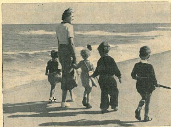
Auf der Strandpromenade

Das Hauptkontingent aller nach Norderney entsandten Kinder leidet an chronischen oder ständig rückfällig werdenden unspezifischen Katarrhen der oberen Luftwege von der Nase bis zu den Bronchiolen. Bei diesen Patienten bewirkt eine Klimakur auf Norderney in etwa 80 %