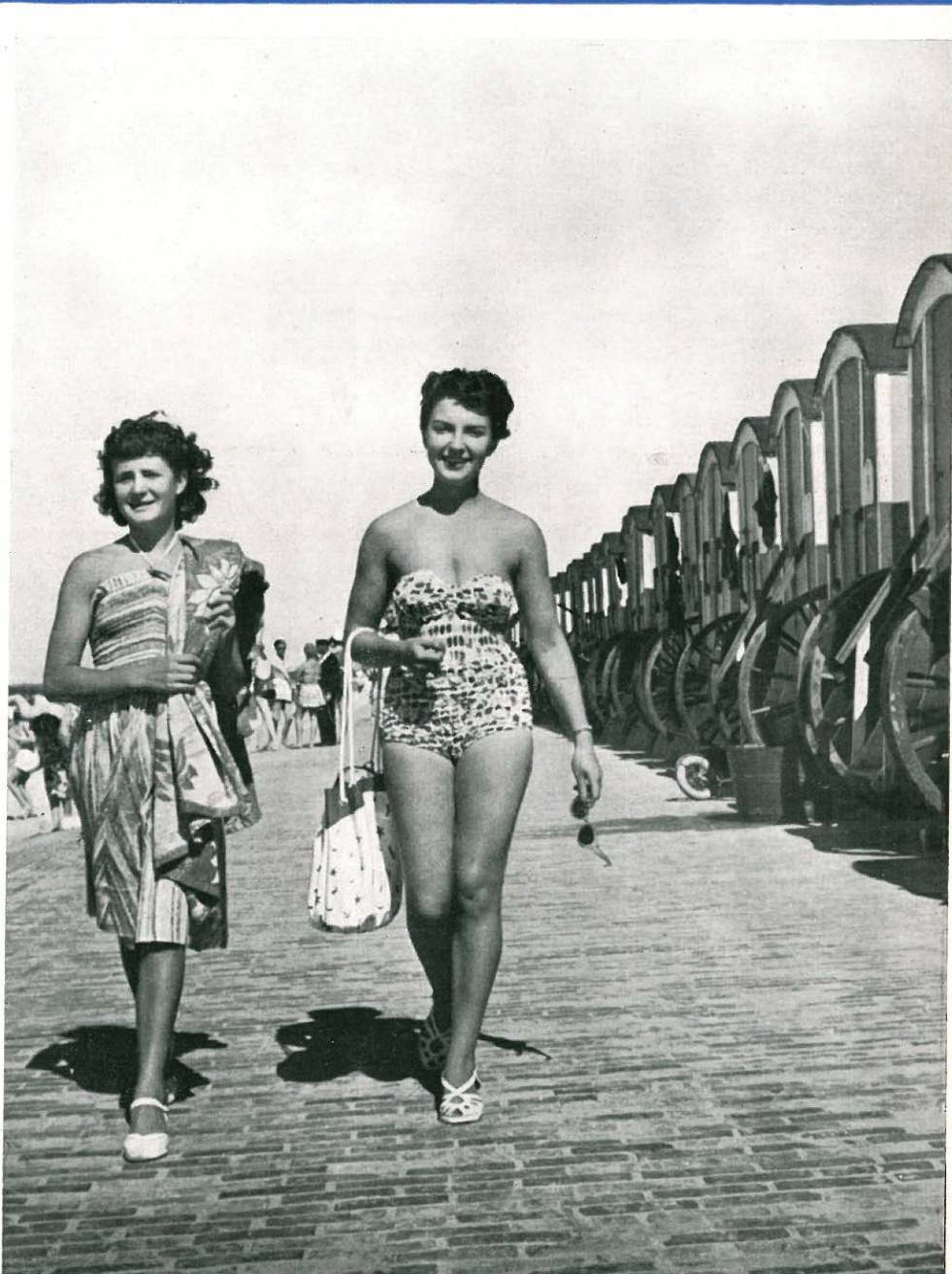
Gleich geht's ins Wasser

HEILBAD FÜR LUFTWEGE NERVEN REKONVALESCENZ ABHÄRTUNG