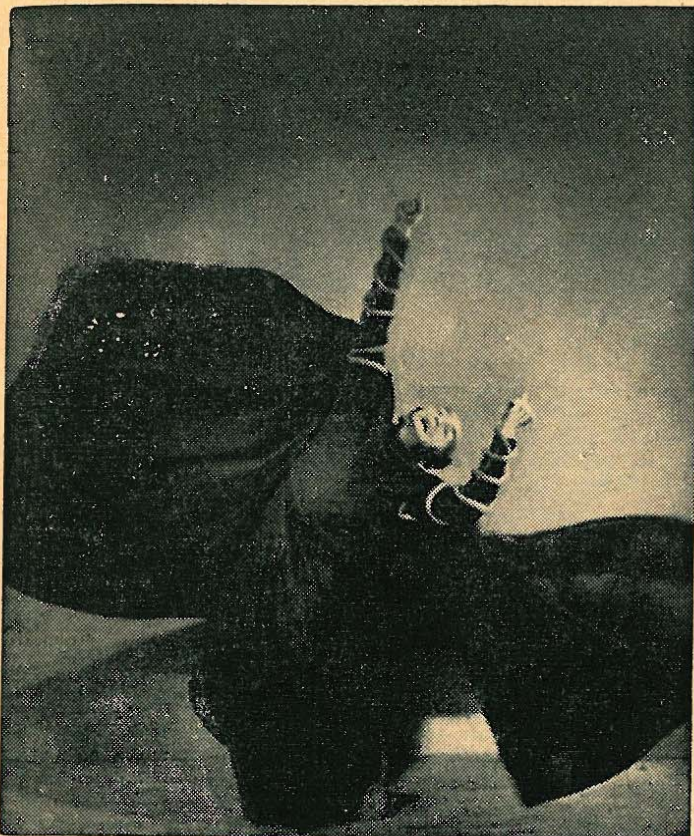
Harald Kreutzberg hat für den modernen Ausdruckstanz die theatralischen und komödiantischen Elemente neu entdeckt. Seine tänzerische Leidenschaft, seine Phantasie-fülle in der ernsten und heiteren Thematik, seine Musikalität, sein Geschmack, sein Humor haben ihn in ihrer Zusammenwirkung zu einer Persönlichkeit von internationalem Gewicht gemacht. Harald Kreutzberg gastiert, wie wir bereits an anderer Stelle berichteten, in dieser Woche auf Norderney