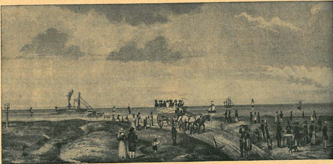
Ankunft vor Norderney um 1850

Ebenso hart wie der Kampf gegen die feindlichen Elemente war die Arbeit ums tägliche Brot. Lohnender Ackerbau war