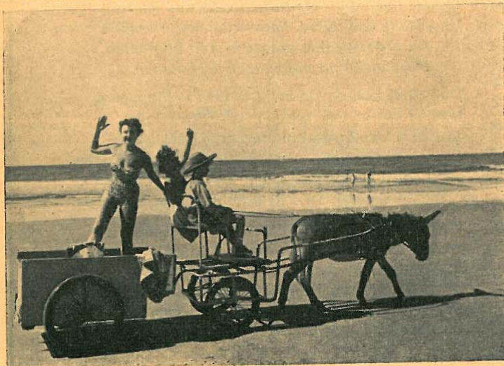
Frohe Strandfahrt ins Blaue