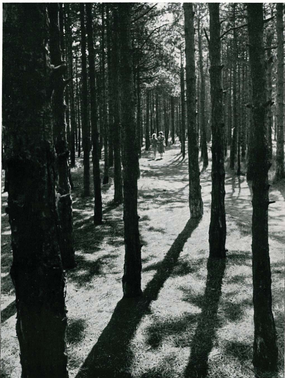
Zu Norderneys besonderen Vorzügen rechnet sein ausgedehnter Inselwald

HEILBAD FÜR LUFTWEGE NERVEN REKONVALESCENZ ABHÄRTUNG